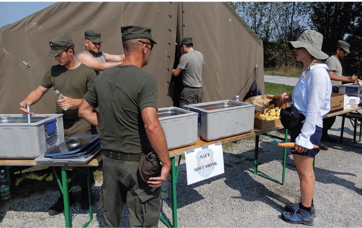
Titelbild: HSV-Wien Sektion Leistungsmarsch und Wandern